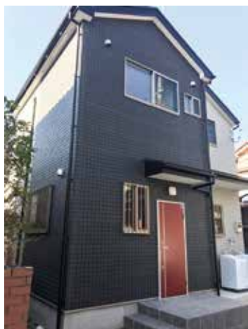
今年に建てた実習生の家

元々は実習生のために中古のアパートを購入していたのですが、老朽化が激しく進んでいる状況でした。そのため、どこか別でアパートを借りることも