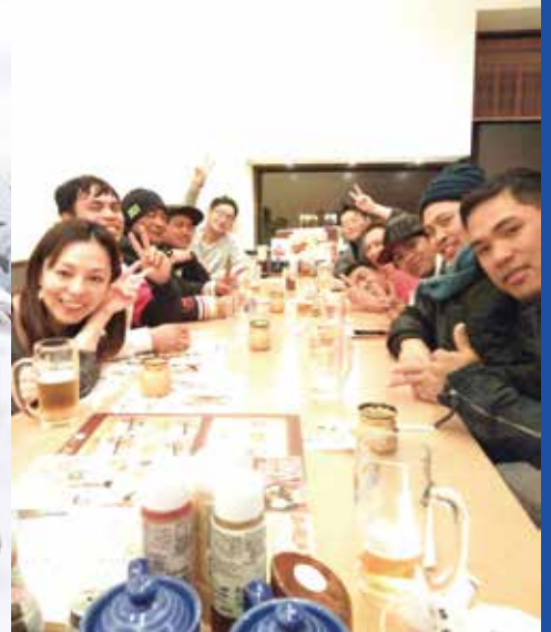
毎月恒例、実習生との懇親会

有限会社誠和鉄筋 志村工業株式会社 http://seiwagroup.jp/company