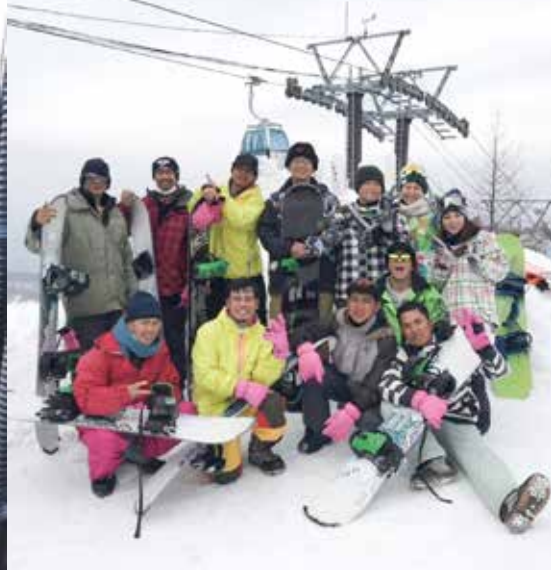
従業員とスノーボード