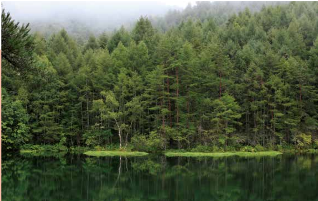
水澄みて 心静まる 御射鹿池 (作:加藤素美)