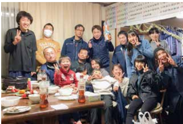
忘年会は事務所でも盛り上がります

請けた現場は、絶対に完成させます。たとえ赤字となっても、私がやると言って請けた以上は最後まで