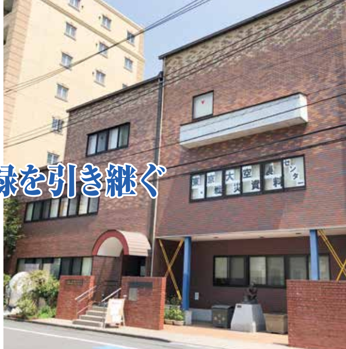
戦災資料センター外観