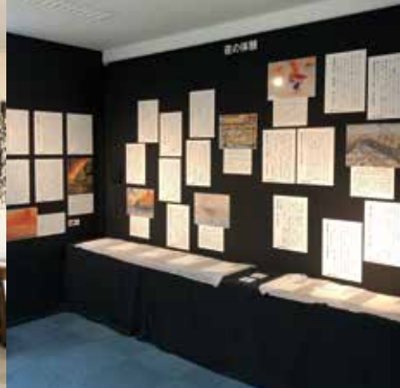
夜の体験コーナー