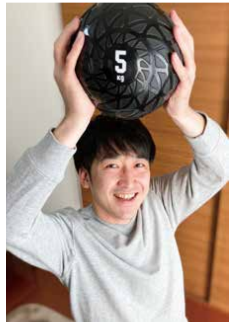
写真はメルカリで購入したトレーニングボール(5kg)と共に