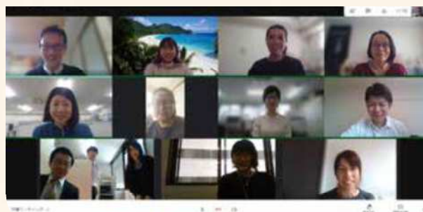
社内会議の様子です

また、社労士資格を持った社内で勤務する職務限定正社員もあり、手続きに関するご相談についてい