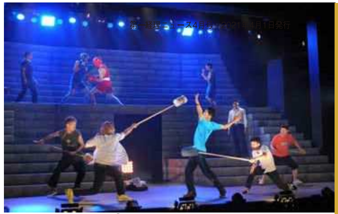
「フライ、ダディ、フライ」

自分の子育て経験からも言えますが、不器用だった子が本領発揮する姿を見るようになった時の嬉しさは格別です。若い劇団員を育成すると同時に、自分も成長する事が出来ます。外部の方から、文化座の若い人は元気で行儀が良いとよく言われるのですが、とても嬉しく思います。私達のお客様は観劇が生活の一部となっている方々です。そのようなお客様のためにも、文化座は皆さんの期待を裏切らない集団でありたいと