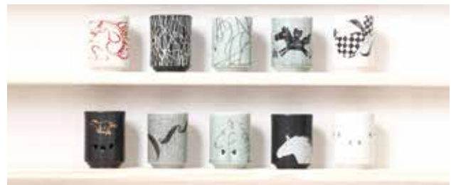
KACHI-UMA 寺内氏の作品は上段真ん中

昨年から続くコロナ禍では、私たちの業界も大きな影響を受けています。仕事上でも個人的にも残念に思