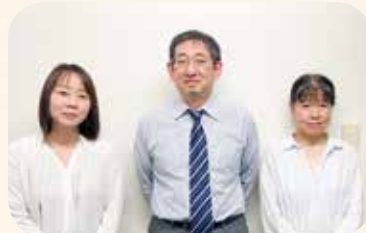
給与チーム (他4名業務中)