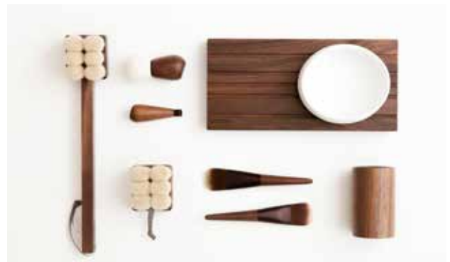
寺内氏がデザインされたプロダクト

う出来事が少なくありません。でも、こと私自身のことを振り返ると学生時代からこれまでどれだけの遠回りや失敗を重ねてきたことか……。落ち込んだこともあります。今になってみればそれらの経験の全てが実になっているようにも思うのです。